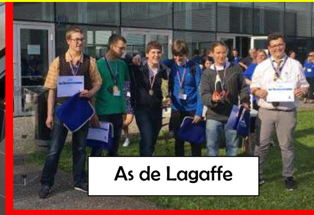
As de Lagaffe